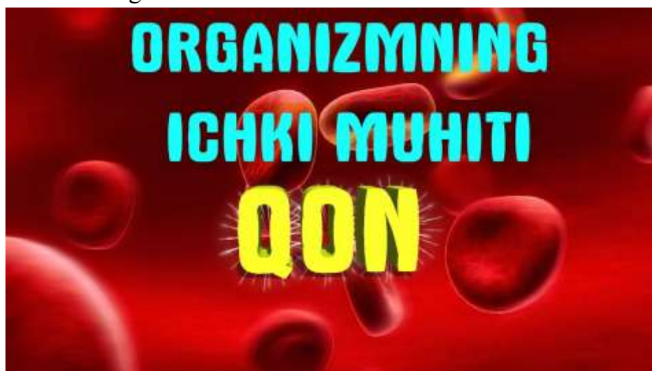
1-rasm. Organizmning ichki muhitini saqlovchi qonning shaklli elementi

Qon plazmasi suv, elektrolitlar, oziqa moddalar, gormonlar va chiqindi mahsulotlarni o'z ichiga oladi.