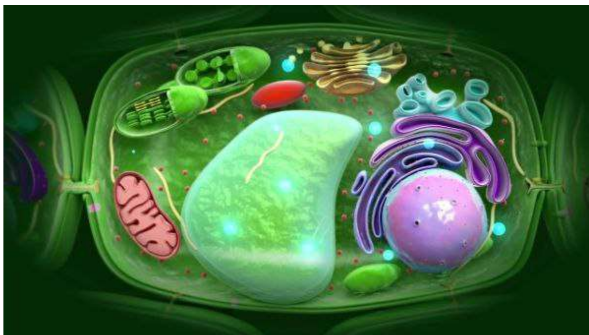
3.5-rasm. Eukariot organizmlar hujayrasi

Eukariotlar tarkibiga hayvonlar, o‘simliklar, zamburug‘lar va protistlar kiradi. Sitoplazma. hujayraning asosiy tarkibiy qismi bo‘lgan sitoplazma tashqi muhitdan plazmatik membrana bilan ichkaridan esa yadro qobig‘i bilan ajralib turadi.