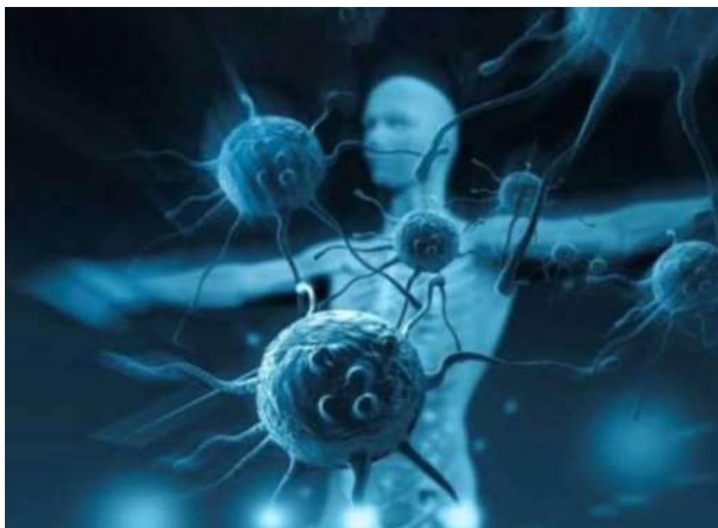
3.11-rasm. Viruslarning inson organizmiga ta’siri