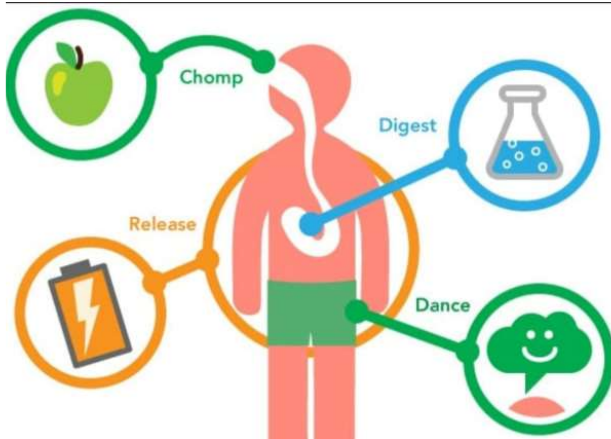
3.13-rasm. Organizmdagi moddalar almashinuvi

Moddalar almashinuvining hujayradagi yana bir muhim funksiyasi hujayrani energiya bilan ta'minlashdir. Organizm hayot faoliyatining har qanday ko'rinishi, ya'ni harakatlanish, ta'sirlanish, oziqlanish, to'qima va organlar faoliyati, tana haroratining doimiyligini saqlash energiya sarflashni talab etadi. Hujayrani energiya bilan ta'minlash uchun organik moddalarning parchalanishi va kimyoviy reaksiyalar natijasida ajralib chiqadigan energiyadan foydalaniladi. Hujayrani energiya bilan ta'minlab beradigan reaksiyalar yig'indisi energetik almashinuv (dissimilatsiya, katabolizm) deb ataladi. Hujayra hayot faoliyatining doimiyligini saqlashni ta'minlovchi plastik va energetik almashinuv reaksiyalari yig'indisi metabolizm, metabolizm mahsulotlari esa metabolitlar deyiladi (21-rasm).