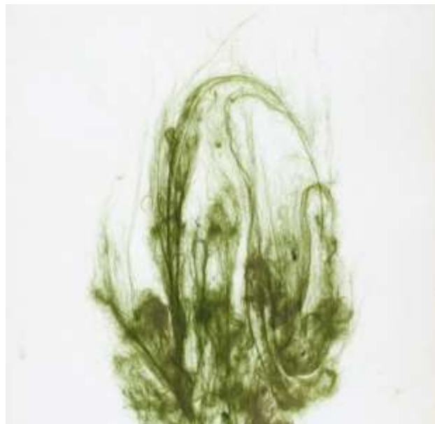
36-rasm. Ko'p hujayrali ulotriksning tashqi ko'rinishi

Suvo'tlar birlamchi ishlab chiqaruvchilar sifatida suv ekotizimining asosini tashkil etadi.