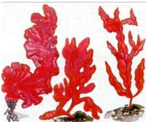
35-rasm. Qizil suvo‘tlar

Bu jarayon natijasida suvo‘tlar nafaqat o‘zlariga, balki butun suv ekotizimiga kislorod manbai bo‘ladi.